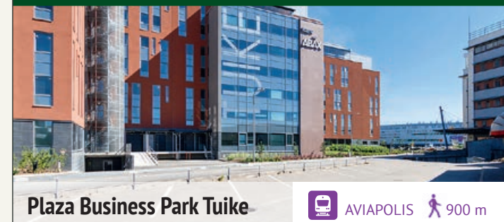
Plaza Business Park Tuusula