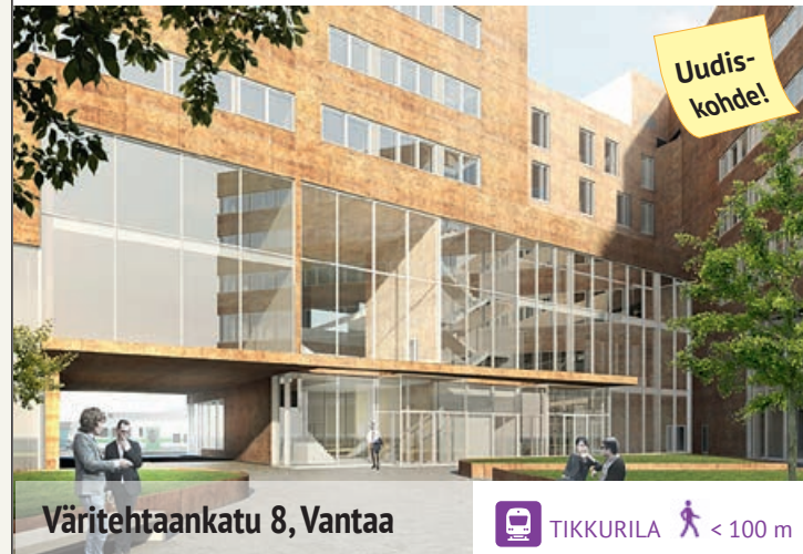
Värehtäankatu 8, Vantaa

Kehitteillä olevat kohteemme Kehäradan varrella: