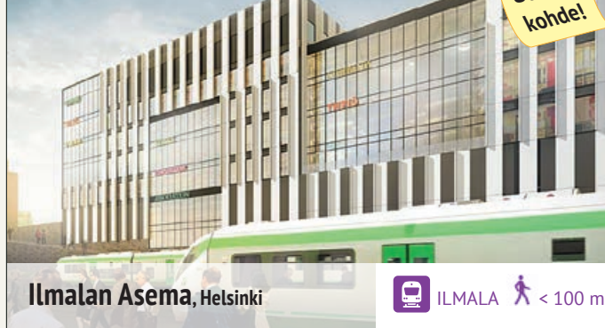
Ilmalan Asema, Helsinki