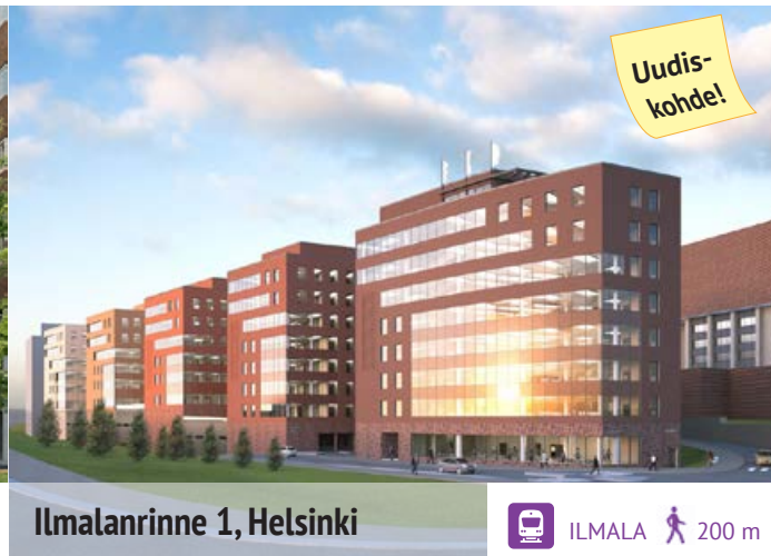
Ilmalanrinne 1, Helsinki

Lisätietoja kohteista: Kari Autio , 040 182 1364, kari.autio@sponda.fi